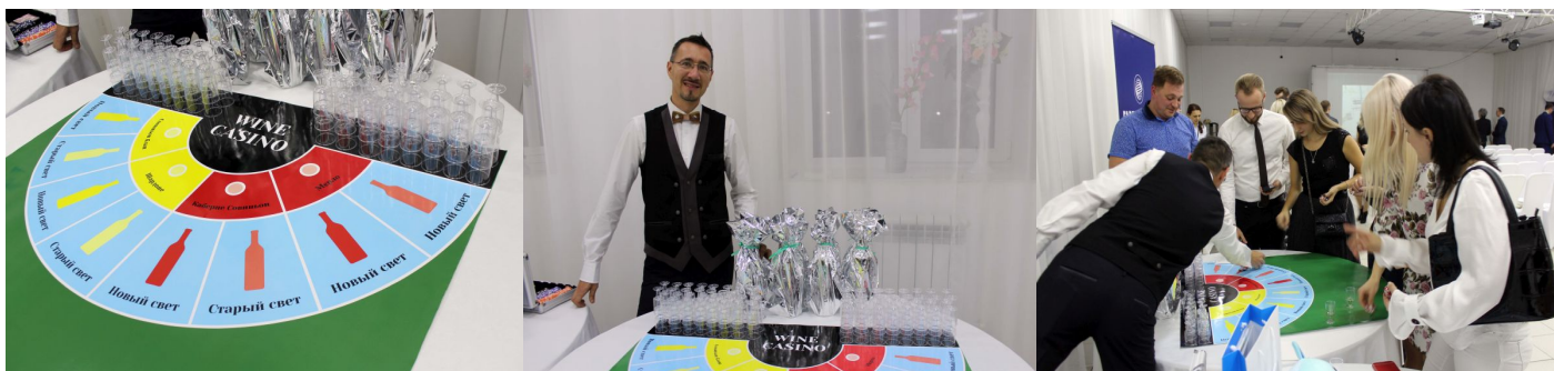
Истина в вине (с)